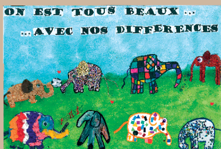
On est tous beaux... avec nos différences Affiche lauréate de l'édition 2013 Accueil périscolaire de Saujon, Charente-Maritime

Dans cette approche, l'action éducative favorise à la fois la réussite scolaire et l'insertion dans la société. Elle puise sa richesse dans la diversité et dans la qualité des loisirs éducatifs, et se développe grâce à un réseau de structures éducatives de proximité : centres de loisirs, multi-accueils, clubs de jeunes.